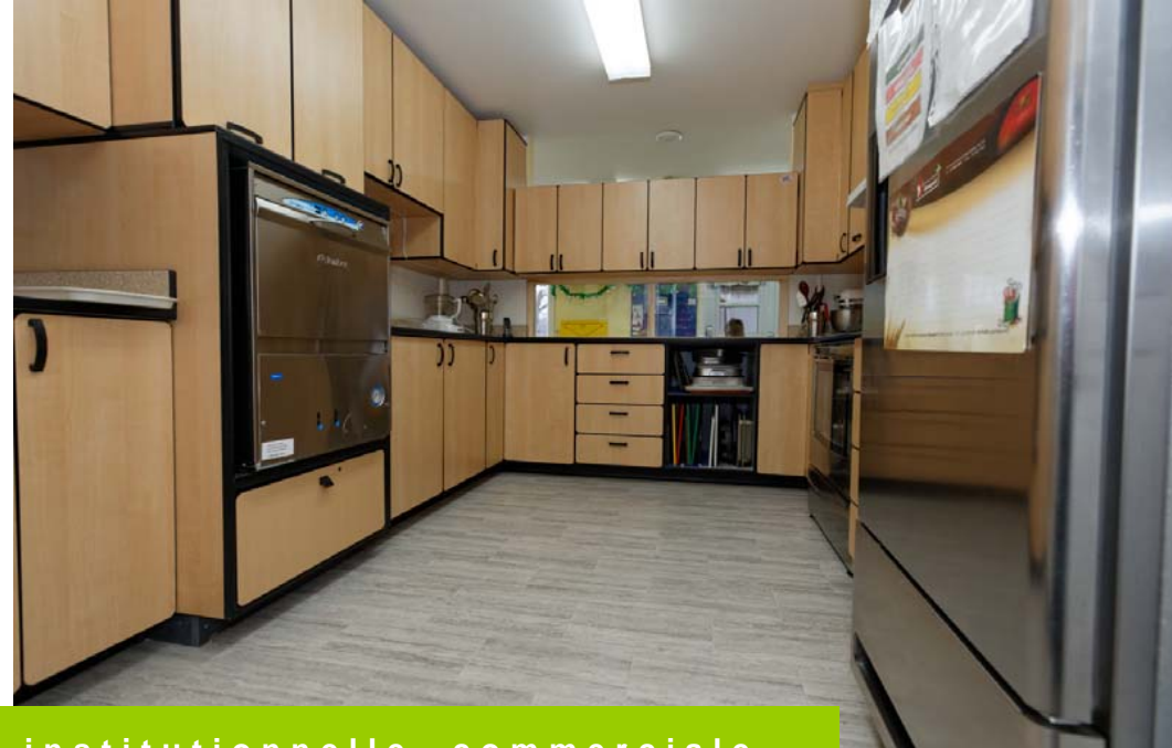
Unité de institutionnelle, commerciale.

Pour commander: 1-877-443-8578 819-846-0336 info@semex.ca